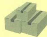
ストーンズ 営業部メンテナンス課 守屋 裕介